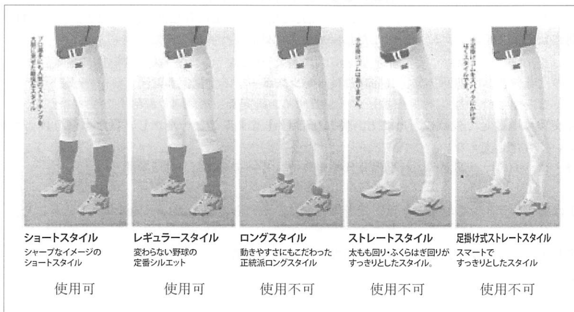
ユニフォームパンツの使用可否の参考図